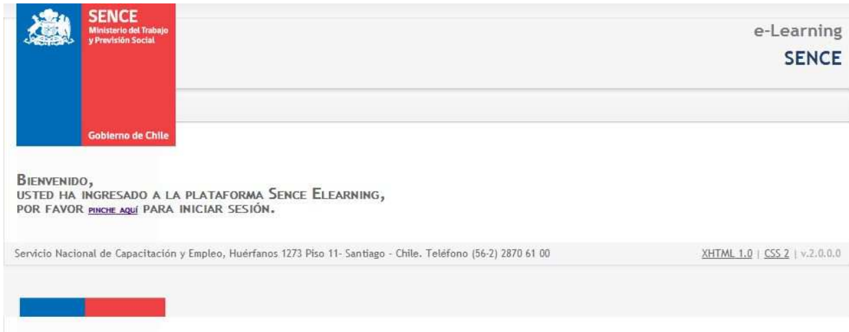
Ilustración 1: Inicio