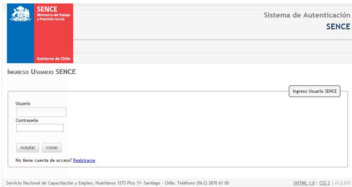
Ilustración 2: Ingreso usuario Sence